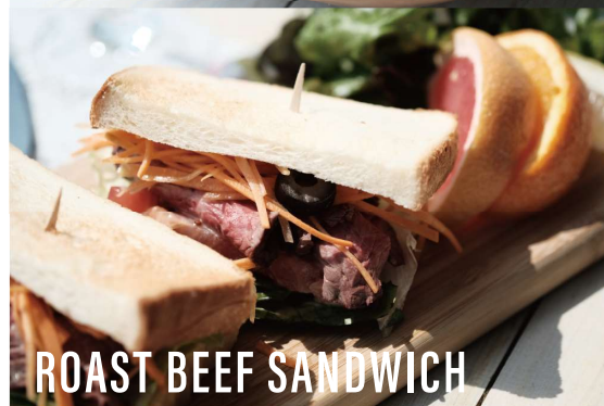
ROAST BEEF SANDWICH