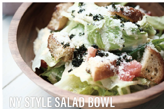
NY STYLE SALAD BOWL